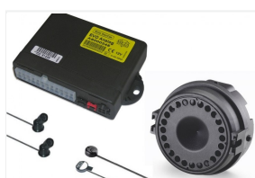
Alarm MetaSystem EasyCan Digital