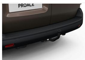
Hak holowniczy stały

Polecane akcesoria niewliczone do powyższej kalkulacji